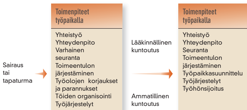
Kuvio 1. Työhön paluun tukemisen prosessin pääpiirteet

Kuviossa 1 on esitetty työhön paluuta tukeva prosessi ja ne toimenpiteet, joita työpaikalla tulisi toteuttaa. Kun työntekijää kohtaa sairaus tai tapaturma, joka vaatii poissaoloa työstä, työpaikalla voidaan ryhtyä moniin toimenpiteisiin, joilla työntekijän poissaoloa lyhennetään ja lisätään onnistuneen työhön paluun mahdollisuuksia. Työnantajan erityisenä tehtävänä on varmistaa, että työntekijä on tietoinen työnantajan sitoutumisesta työhön paluun tukemiseen. Työnantajan tulisi myös toimia läheisessä yhteistyössä lääkinnällisestä ja ammatillisesta kuntoutuksesta vastuussa olevien tahojen kanssa. On kuitenkin muistettava, että sairautta koskevat tiedot ovat henkilötietolain mukaisia arkaluonteisia tietoja. Sairausloma on lähtökohtaisesti toipumista varten, eikä sairauslomalla olevaa saa painostaa. Kyse täytyy aina olla työntekijän, hoitavan tahon, työterveyshuollon ja lähiesimiehen yhteisestä näkemyksestä työhön paluun oikeasta ajoittamisesta. Työntekijällä on myös aina oikeus ottaa yhteyttä työsuojeluvaltuutettuun, luottamusmieheen tai ammattiliittoon, kun hänen asioitaan käsitellään.